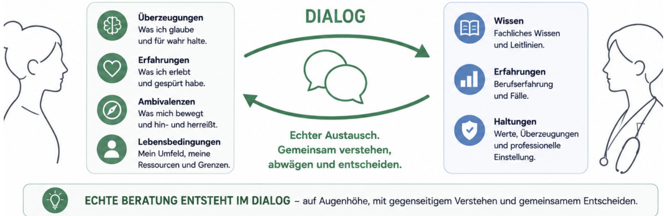
Abb: Eigene Darstellung, erstellt mit ChatGPT (OpenAI)