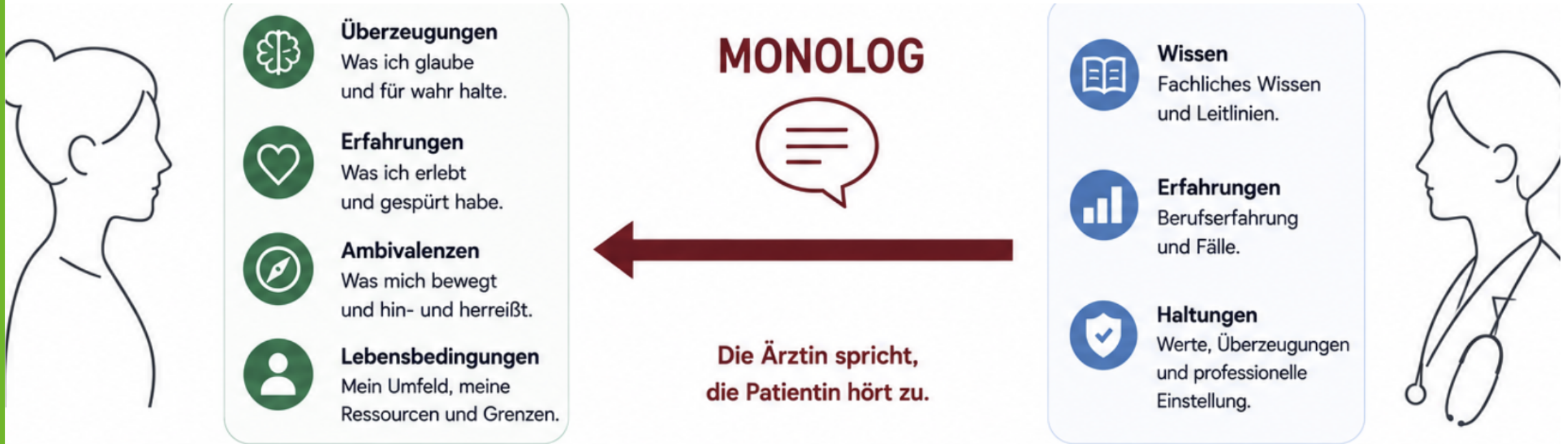
Abb: Eigene Darstellung, erstellt mit ChatGPT (OpenAI)